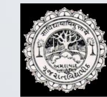
Gujrat Vidyapeeth Ahemdabad